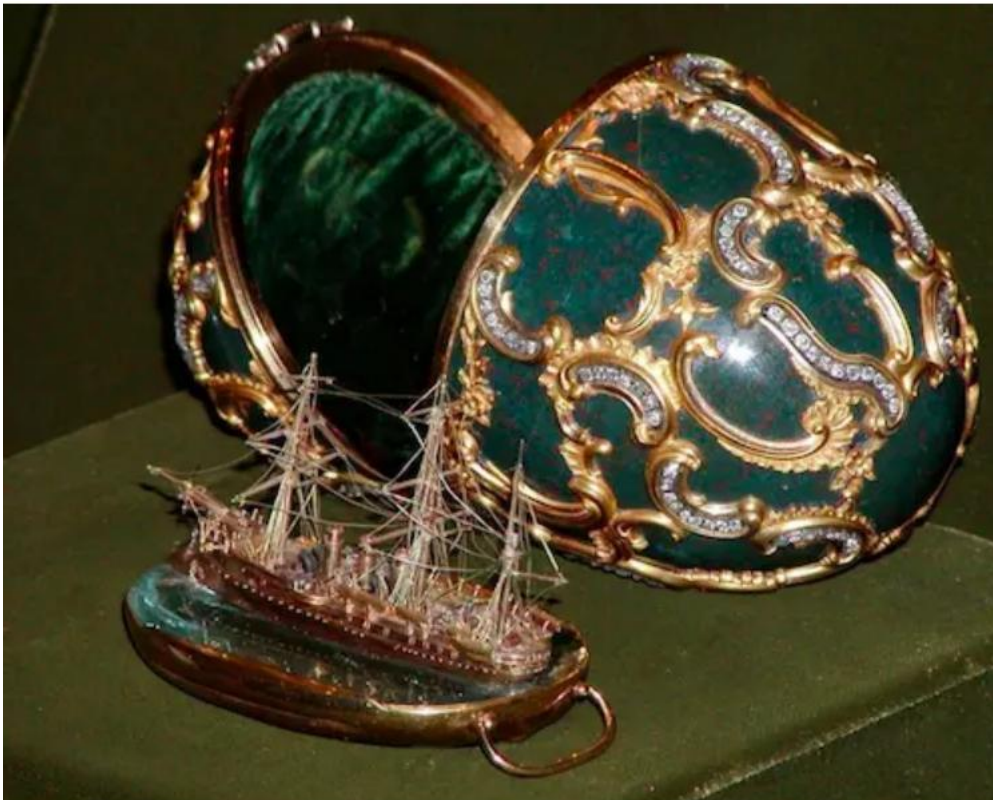
L'œuf au Pamyat Azova (1891), réplique du navire sur lequel vogua le futur Nicolas II

En 1890, le tsarévitch Nicolas embarque pour une grande expédition de 10 mois en Orient. Il offre tant de créations Fabergé à ses hôtes successifs qu'on doit lui expédier de nouvelles pièces en urgence ! La Cour de Siam, actuelle Thaïlande, manifeste un vif intérêt et devient par la suite l'un des principaux clients de Fabergé. Pour son œuf de Pâques de 1891, Fabergé choisit de commémorer le périple du prince héritier. La coquille est faite d'héliotrope, une pierre vert sombre suggérant la profondeur de l'océan et sur laquelle sont appliquées des volutes d'or sertis de diamants. Lorsqu'on l'ouvre se dévoile, posée sur une plaque d'aigue-marine, une réplique exacte en or du navire sur lequel navigua Nicolas.