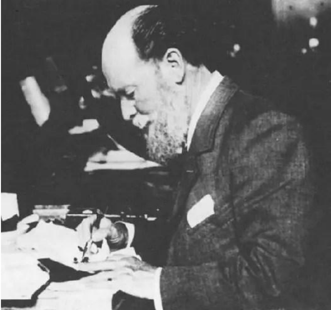
Carl Fabergé dans les années 1900

La maison Fabergé est à présent réputée dans toute l'Europe pour la qualité de ses émaux, qui possèdent une profondeur inégalée grâce à la technique du guillochage. Un travail complexe surtout sur une pièce arrondie, car obtenir des couleurs très pures et très limpides est extrêmement difficile. Aucune marge d'erreur n'est possible, Fabergé a donc un taux d'échec d'environ 30 % !