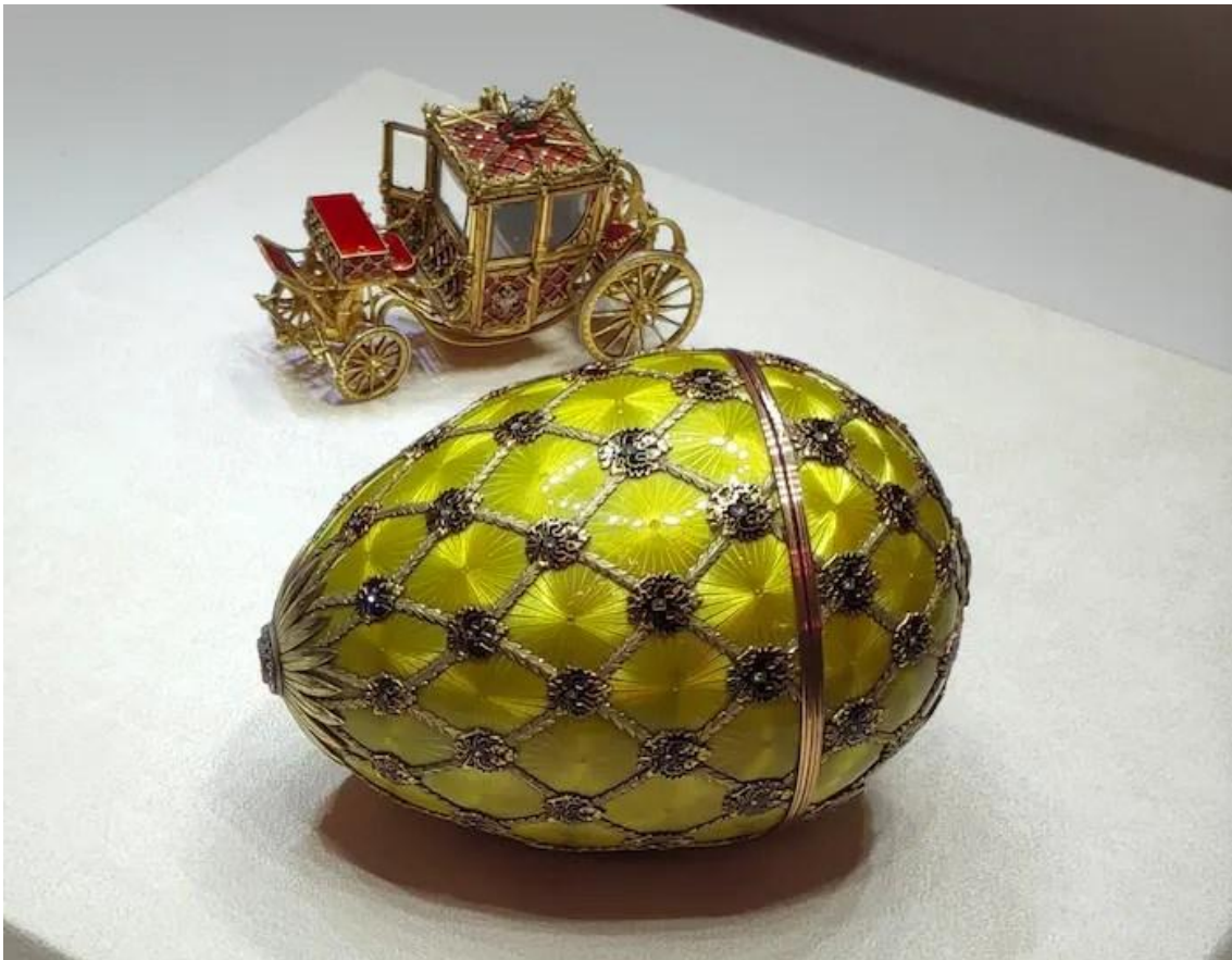
L’œuf du couronnement (1897) fabriqué à l’occasion du couronnement de Nicolas II et Alexandra Feodorovna (diamant, or, émail et cristal)

En 1914, Fabergé réalise l’un de ses derniers œufs, l’Œuf aux mosaïques : il témoigne d’une excellence qui en fait l’un des plus beaux des 50 œufs impériaux réalisés au total. Cette même année, la Russie commence à subir des revers et Fabergé à perdre ses employés, mobilisés au combat et rapidement tués car sachant à peine manier un fusil. La population est vite accablée ; les salaires sont en chute libre, les sans-abris meurent de faim et de froid. Le couple impérial, détaché de son peuple, continue à vivre dans un conte de fée... jusqu’à l’abdication de Nicolas II en février 1917.