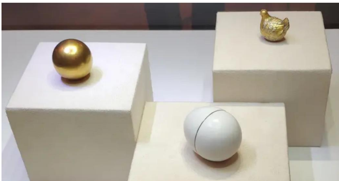
L'œuf à la poule, premier de la série ! (Musée Fabergé de Saint-Pétersbourg)