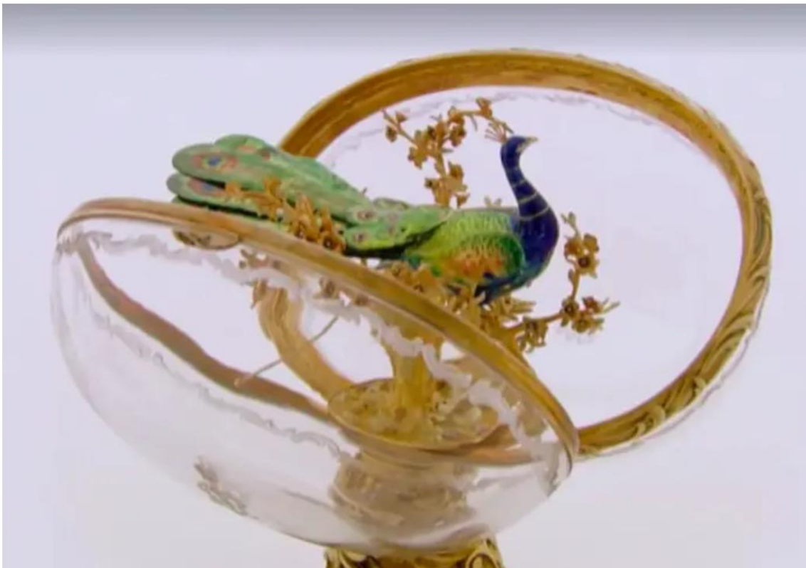
L'œuf au paon - Fondation Edouard et Maurice Sandoz (Suisse)

Dans deux vitrines pyramidales se trouvent les merveilleux œufs émaillés de Fabergé. Ce sont les cadeaux que l'empereur a faits aux deux impératrices pour Pâques. [...] Très curieux, un œuf sur lequel est tracée la carte du chemin de fer de Sibérie et qui renferme un petit modèle en or du train sibérien. Ce ravissant petit joujou se remonte et le train peut parcourir les tables.