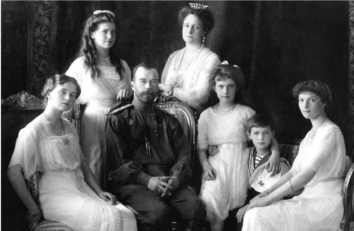
Nicolas II, son épouse, et leurs 5 enfants en 1913