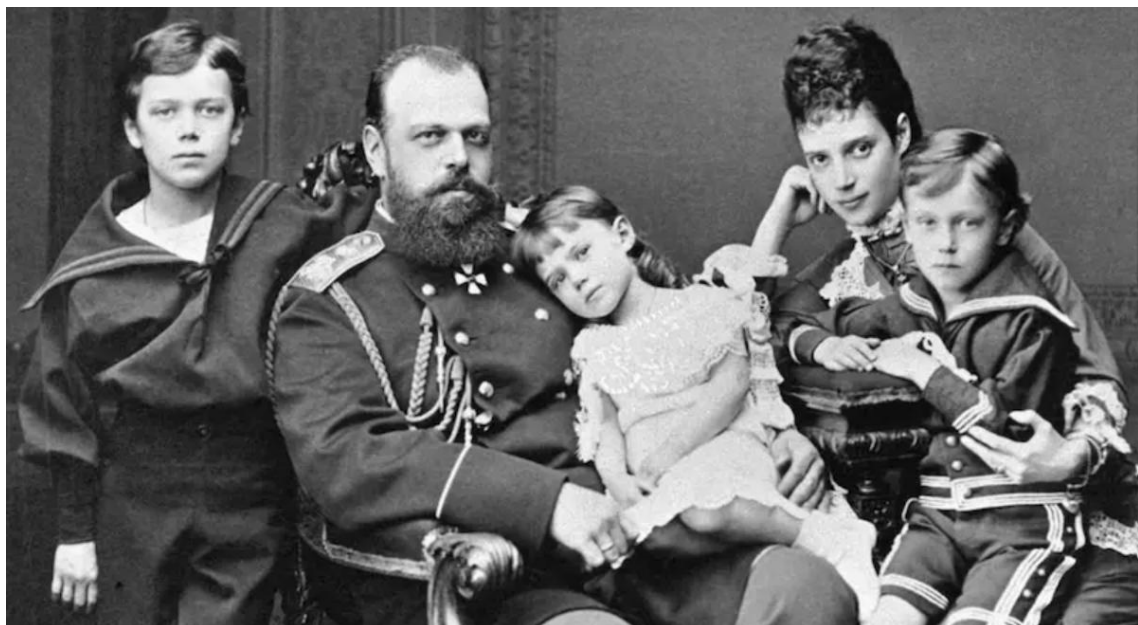
Alexandre III et son épouse avec leurs aînés vers 1878

Le premier œuf Fabergé fut pour Maria Feodorovna