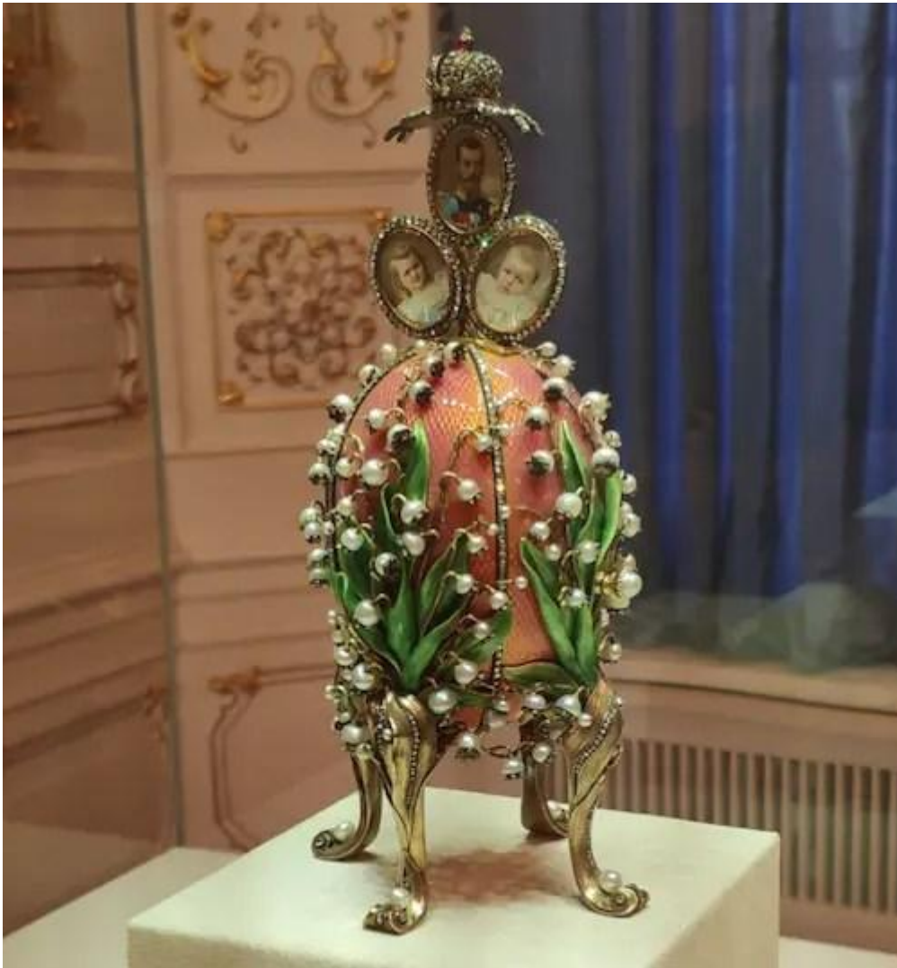
L'oeuf au muguet (perles fines, rubis, diamants, cristal, or, vermeil et émail)

La surprise de l'Œuf mauve, qui est perdu (1897)