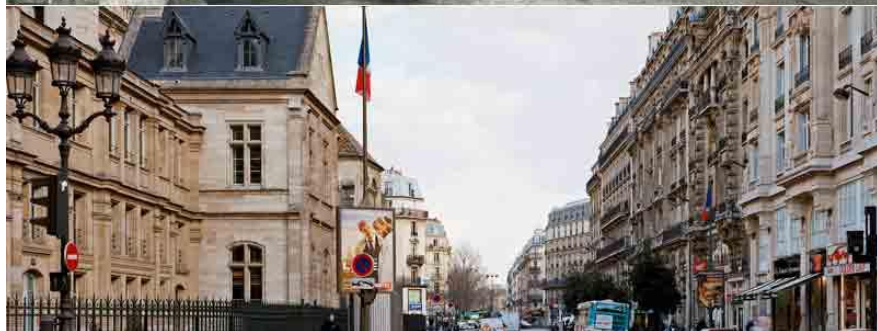
Avant et après les travaux d'Haussmann

Le quartier de l'Hôtel-de-Ville notamment sera entièrement repensé en ce sens et de nombreux faubourgs seront dissous.