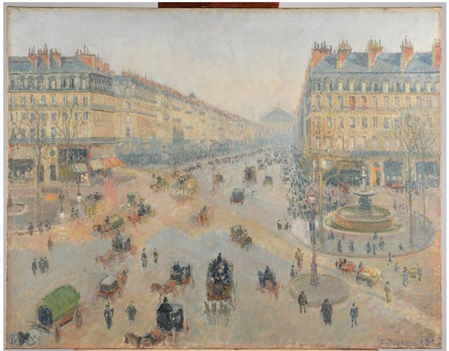
L'avenue de l'Opéra vue par Pissarro depuis l'actuel hôtel du Louvre.

Camille Pissarro — Musée des Beaux-Arts, Reims