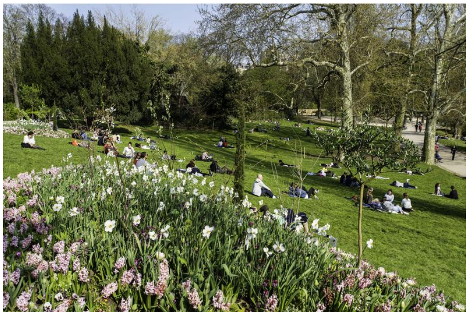
Le parc des Buttes-Chaumont est aussi une réalisation due à Haussmann

Dès 1860, Napoléon III lance un grand concours et érige le projet d'un nouvel Opéra. Cette nouvelle priorité impériale fait grand bruit et plus de 171 concurrents s'affrontent pour décrocher le projet. Le Baron Haussmann suivra avec attention toutes les étapes de construction de ce nouvel édifice, inauguré en 1875 après plus d'une quinzaine d'années de travaux.