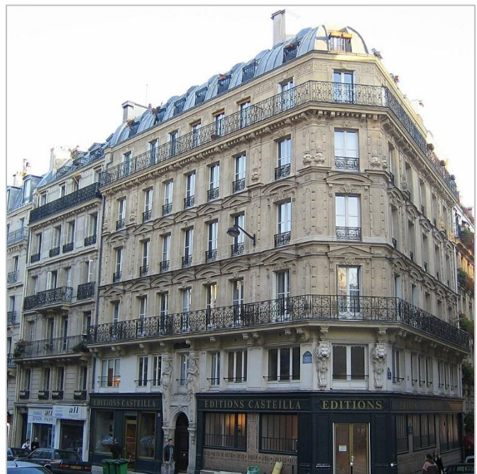
Un immeuble Haussmannien