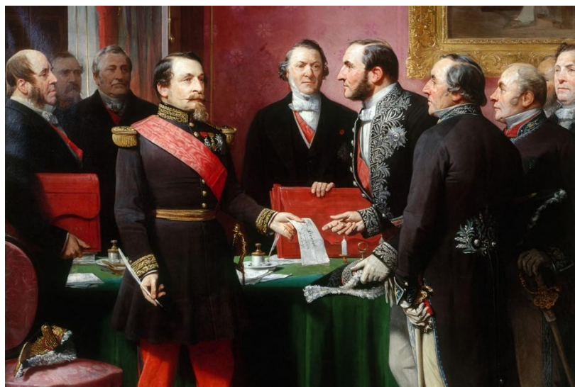
Napoléon III remettant au baron Haussmann le décret d'annexion des communes limitrophes le 16 février 1859 (peinture d'Adolphe Yvon).

Napoléon III apprécie les initiatives d'Haussmann, qui est alors nommé préfet de la Seine le 22 juin 1853, avec comme première mission d'embellir Paris.