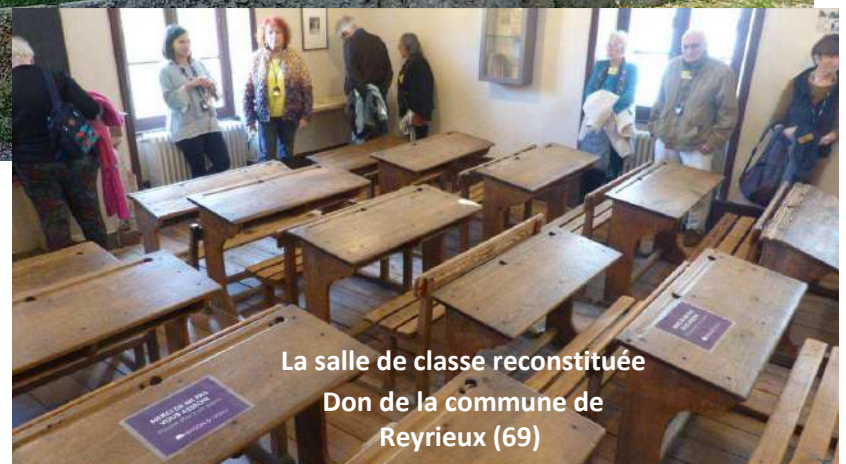
La salle de classe reconstituée Don de la commune de Reyrieux (69)