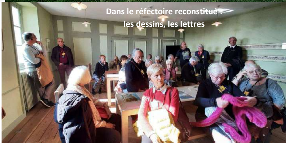
Dans le réfectoire reconstitué, les dessins, les lettres