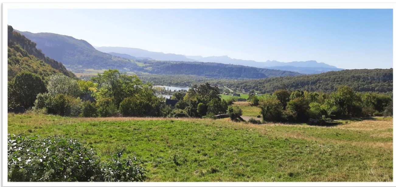
Le panorama alentour, sur la Chartreuse et le Nord du Vercors

Le site, isolé, qui surplombe le Rhône et s'ouvre à l'horizon sur la chaîne des Alpes comprend la maison, prolongée par une longue terrasse et deux bâtiments agricoles, la grange et la magnanerie.