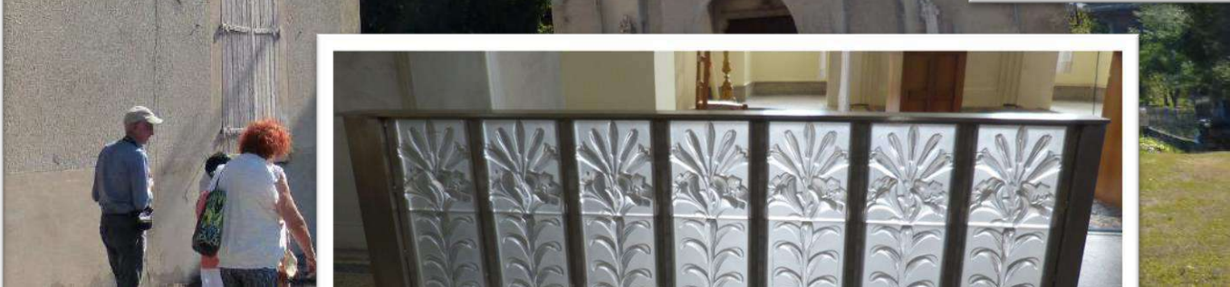
Table de communion en demi-cristal de René Lalique à décor de fleurs de lys