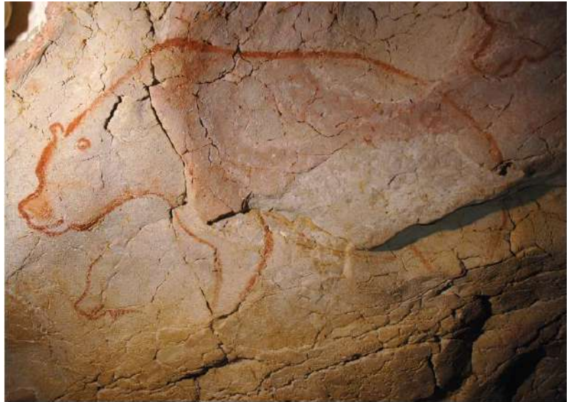
L'ours du diverticule de la salle Brunel de la Grotte Chauvet

Le passage de ces Homo sapiens qui venaient dessiner sur les parois durant l'été - quand les ours étaient sortis, bien sûr - est daté (au carbone 14) à -36 000 ans, mais un autre séjour qui n'a laissé que des empreintes de pas, remonte à -30000 ans. Pendant les millénaires de ces occupations, des groupes de 10/20 personnes ont régulièrement fréquenté la grotte.