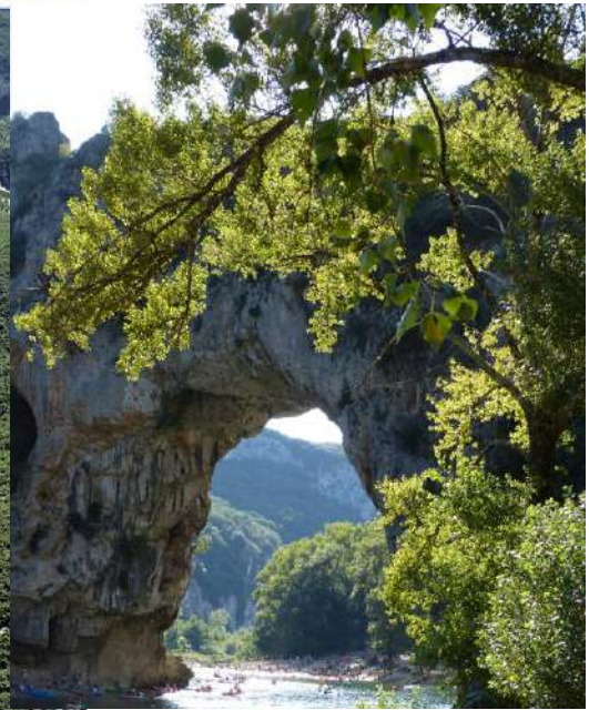
L'arche du Pont d'Arc.