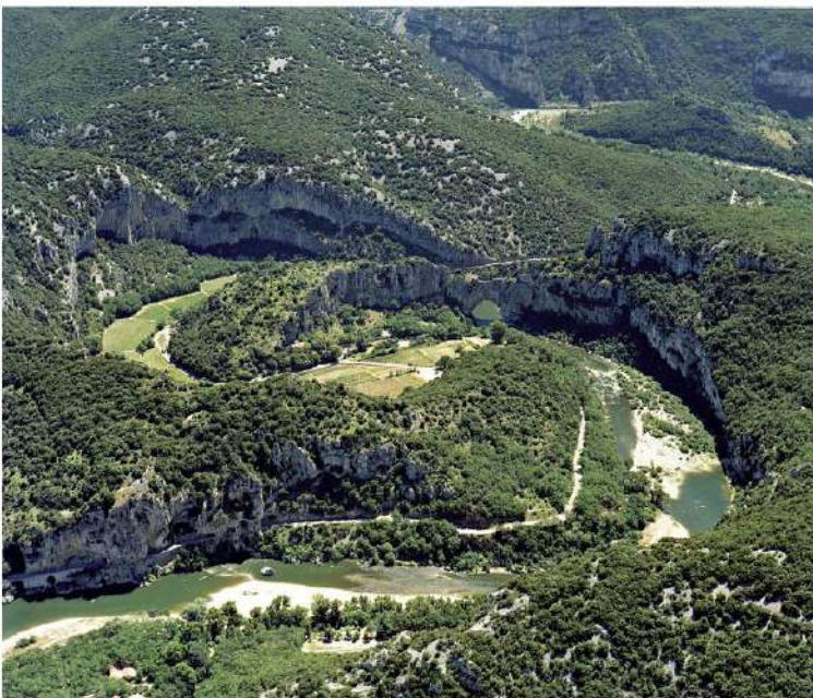
Panorama de la Combe d'Arc.