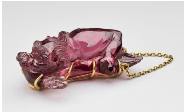
Le spinelle, dit "Côte de Bretagne", en forme de dragon

Les bagues étaient en 1530 au nombre de sept.