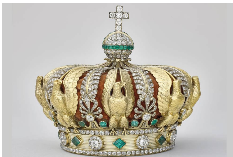
Couronne de l’impératrice Eugénie