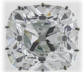
Diamant dit Le Régent

Exposé au Musée d'histoire naturelle de Washington, son histoire et sa beauté lui valent d'être le diamant le plus célèbre du monde.