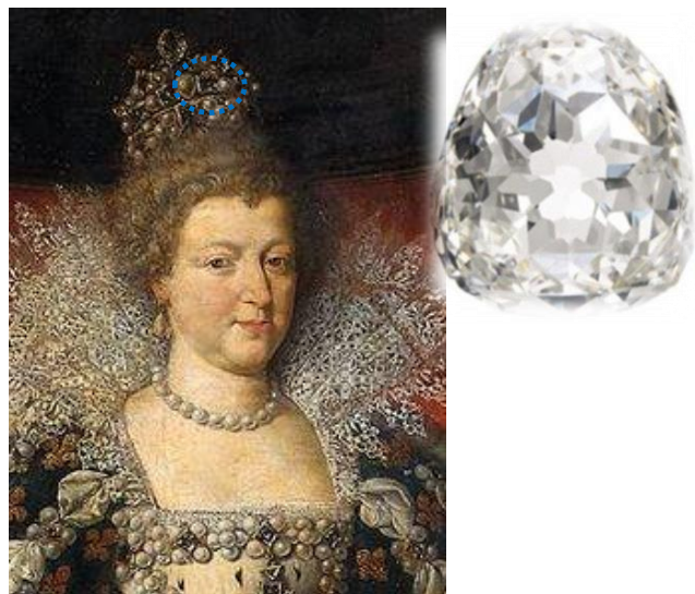
Portait du couronnement de Marie de Médicis Peinture de Frans Pourbus le jeune.

Le lendemain, Henri IV est assassiné. Marie de Médicis, mère de Louis XIII qui n'a que neuf ans, assure la Régence. Pour payer ses créanciers elle finit par vendre le “Beau Sancy” au Prince d'Orange-Nassau en 1641.