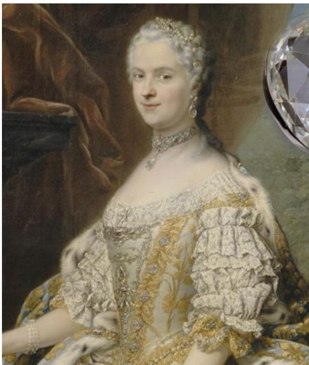
Marie Leszczyńska, reine de France (1703-1768) peinte en Grande robe de cour en 1747 par Vanloo Charles André Elle porte le Sancy en pendentif

La petite histoire raconte que le messenger de Nicolas Harlay de Sancy transportant le diamant d'Orient en Europe fut attaqué et tué...et que le diamant fut récupéré par son mandataire dans l'estomac de son émissaire, qui avait avalé la pierre avant de mourir.