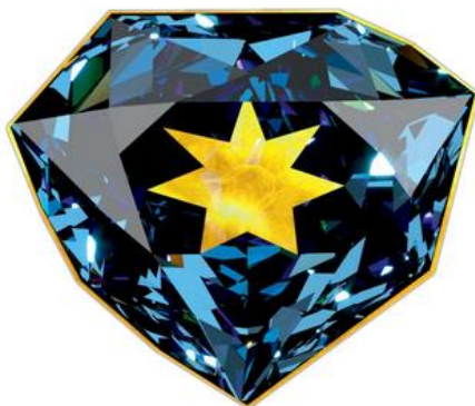
Simulation du Diamant bleu de Louis XIV serti or

Le "Grand Saphir" (cf. photo de droite ) est le joyau actuel du Muséum national d'Histoire naturelle (MNHN).