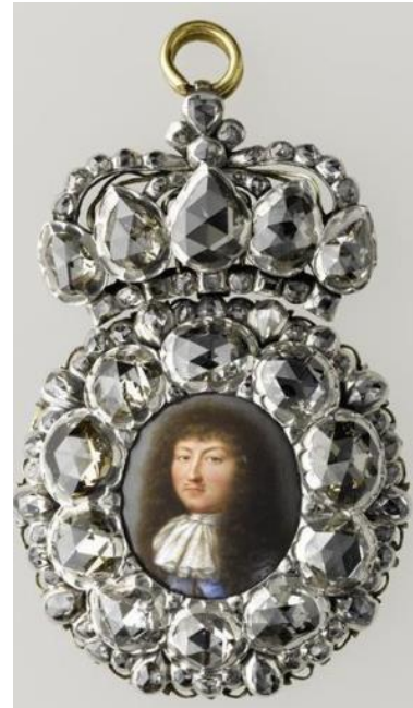
Boîte à portrait incrusté de diamants vers 1680 - Musée du Louvre -