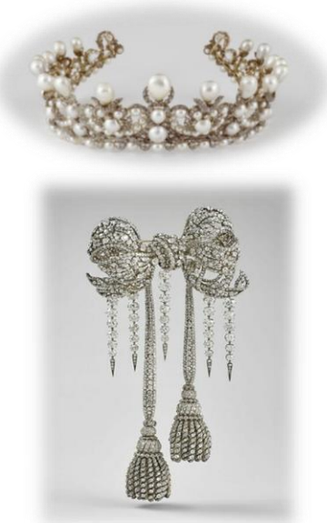
A gauche : l'impératrice Eugénie portant le diadème de perles A droite : le diadème de perles et le grand nœud de corsage de l'impératrice Eugénie

Depuis 1988, Le Louvre et la Société des Amis du Louvre rachètent ces bijoux quand ils réapparaissent.