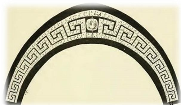
A gauche : l'impératrice Eugénie porte le diadème à méandres ou à la grecque orné du Régent A droite : le dessin de ce diadème par le joaillier Alfred Bapst (au centre, le diamant Le Régent)