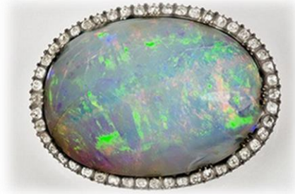
Grand opale du manteau de sacre de Charles X

La couronne de l’Impératrice, visible au musée du Louvre ainsi que cinq bijoux de premier ordre de l’impératrice, est composée de 2480 diamants de 56 émeraudes qui appartenaient à l’empereur. Les motifs et l’aigle et de la palmette sont typiquement des symboles impériaux.