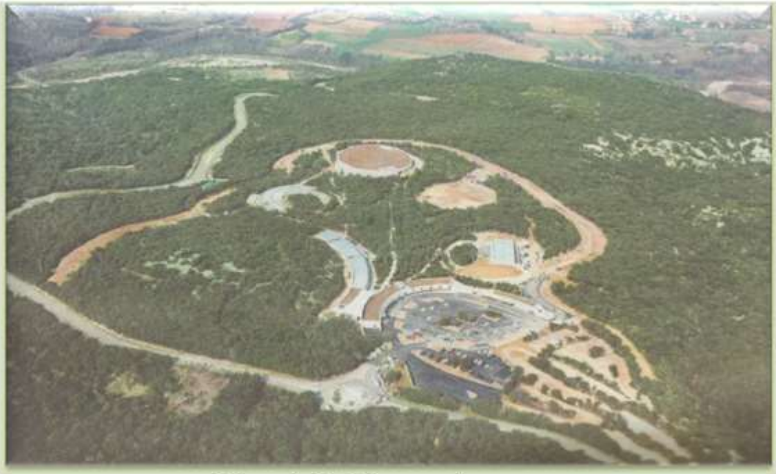
Vue aérienne du site de la Grotte Chauvet 2