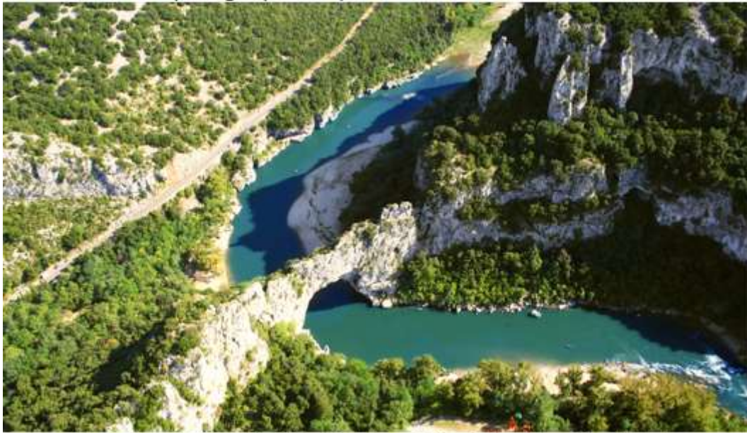
Vue sur le pont d'Arc et la falaise du cirque d'Estre abritant la grotte originelle

30 km au Sud d'Aubenas. L'entrée de la grotte se trouve sur une falaise du cirque d'Estre, inaccessible et désormais protégée par une porte blindée.