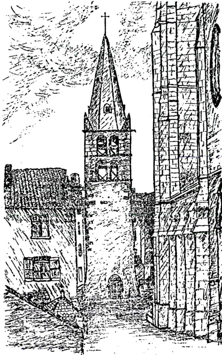
Le vieux clocher du XII e siècle, à BOURGOIN d'après une photographie de 1875 prise par M. Diederichs.